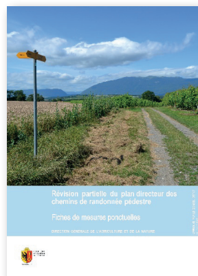
Documents issus de la révision du plan directeur des chemins de randonnée pédestre.

L'Etat de Genève et GenèveRando s'attèlent maintenant à la mise en œuvre de ces mesures, avec deux modifications notables réalisées fin 2018 par les baliseurs bénévoles l'association, sur le parcours de la Via Jacobi en Ville de Genève et sur sol carougeois ; une modification par ailleurs saluée par les pèlerins empruntant le chemin de Saint-Jacques de Compostelle.