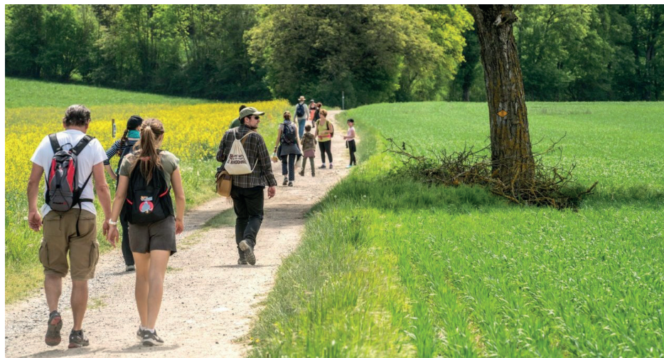
Sur le parcours de la journée cantonale sur les chemins de randonnée 2018.

Le parcours, balisé par les bénévoles de l'association, s'articulait autour des réserves naturelles longeant le Rhône, entre La Plaine et le barrage de Verbois. Grâce à des postes jalonnant le parcours, un public très varié a pu découvrir les richesses naturelles et historiques de la région; sans oublier l'agriculture, le terroir et la randonnée pédestre bien sûr!