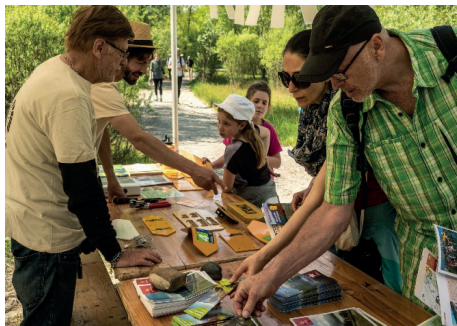
De nombreux stands d'information ponctuaient le parcours de la manifestation, comme le poste sur la faune genevoise tenu par les gardes de l'environnement (gauche) et celui de GenèveRando (droite).

Un succès sans précédent qui a permis d'inscrire durablement la manifestation dans l'agenda des événements estivaux du canton. Rendez-vous est donc pris le 6 juillet 2019 pour un parcours à la découverte des nombreux trésors situés cette fois dans la région de la plaine de la Seymaz.