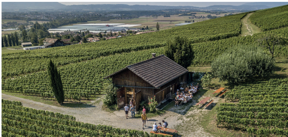
Etape du Rallye Gourmand 2018, sur le coteau de Bernex.

En 2019, l'OPAGE et GenèveRando vous donnent rendez-vous dans autre coin de la campagne genevoise, avec un parcours rempli de belles surprises. Ce sera le weekend du 10 au 11 août.