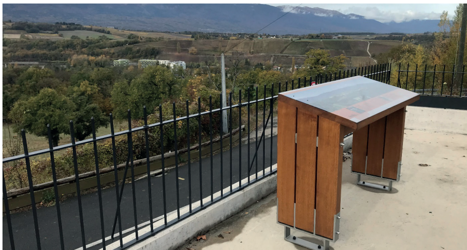
Table panoramique d'Avully.

Notons également que GenèveRando a participé au Salon de la Montagne qui a rassemblé un peu plus de 20'000 visiteurs en marge des Automnales à Palexpo. Enfin, l'association a offert aux randonneurs qui parcourent la Balade Viticole « Entre Arve et Rhône » une nouvelle table panoramique, qui a été installée sur un belvédère situé dans la commune d'Avully, et qui propose une vue saisissante sur le Mandement et le Jura. Cette table vient compléter les trois autres installations du même type déjà financées par GenèveRando et les quelques 75 bornes d'information que comptent les trois itinéraires formant la Balade Viticole.