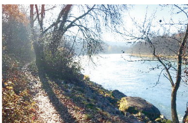
Le sentier en rive gauche du Rhône qui remplace la route goudronnée

Profitant de ces travaux, Genève Rando a également réalisé une autre mesure du PDCRP sur l'autre rive du Rhône, consistant en le remplacement d'un long tronçon qui empruntait une route forestière goudronnée par un sentier muni d'un revêtement naturel longeant le Rhône et offrant une magnifique vue sur le fleuve. Durant les préparatifs, nous avons par ailleurs identifié et mis en œuvre une possibilité supplémentaire d'améliorer l'itinéraire, consistant à emprunter un escalier qui borde le barrage de Verbois et utiliser un chemin naturel qui longe la passe à poissons du barrage. Ceci en lieu et place d'un passage par une route goudronnée d'accès à