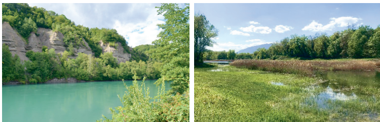
De magnifiques points de vue depuis le chemin traversant les Teppes de Verbois.

présentant de magnifiques points de vue sur le Rhône, permet d'accéder à trois observatoires à faune donnant sur les étangs qui bordent le fleuve. Une zone loisir librement accessible munie de tables de pique-nique et de foyers pour la grillade se trouve également sur ce chemin.