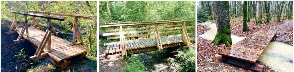
Une partie des nouvelles passerelles qui agrémentent l'itinéraire Moulin Fabry - Camping de l'Allondon.

L'année écoulée est particulièrement représentative de ce travail mené de concert avec l'Etat de Genève. L'événement le plus marquant au niveau de l'infrastructure du réseau est sans doute la réouverture d'un des plus beaux chemins du canton, à savoir le sentier qui longe l'Allondon entre le Moulin Fabry et le camping de l'Allondon dans la commune de Satigny. Pas moins de 7 ans auront été nécessaires entre la fermeture de ce chemin, pour raison de sécurité, et sa réouverture. Ce projet est assez représentatif des nombreuses difficultés que l'on peut rencontrer dans ce type de contexte, entre négociation avec les propriétaires privés, questions de responsabilité et conciliation avec les enjeux de conservation de la nature. Si l'on peut regretter qu'autant de temps ait été nécessaire pour rétablir la situation, ce magnifique sentier bénéficie maintenant de nouveaux ouvrages construits durablement et réalisés en chêne genevois par l'Etat de Genève.